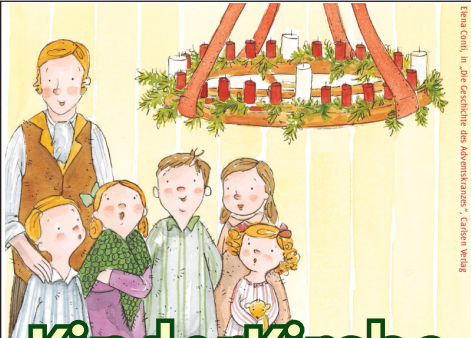
© Maria Confr. in „Die Geschichte des Adventkranzes“ - Carsten Wang